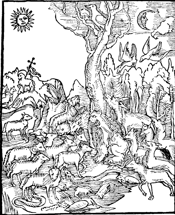
Ich sage ewch/wo dise sweygen/so werde die stein schreyen. lucc. xix.