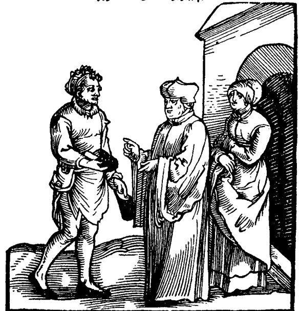
Ich sag euch / wa dise schweige / so werde die steinschnele. lu. 19

Houtsnede van het titelblad van de eerste druk van «Disputacion zwischen einem Chorherren und Schuhmacher» uit 1524