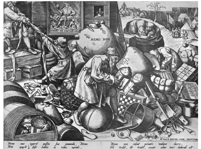
Satire op het winstbejag van de kooplu. Ets van Pieter Bruegel de Oude uit 1560